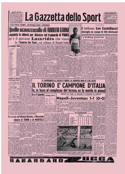
La Gazzetta dello Sport, n°177, juillet 1946

Une réelle stratégie de propagande est alors mise en place en Italie afin d'attirer les Italiens et de les pousser à aller travailler en Belgique. De grands prospectus sont par exemple affichés dans les villes et villages. Ils promettent entre autres des conditions de travail rêvées, l'accès à un logement confortable avec possibilité de faire venir la famille, un salaire établi sur les mêmes bases que ceux accordés aux travailleurs belges, des allocations familiales pour les enfants résidents en dehors de l'Italie, etc. Pour l'anecdote, ces affiches étaient imprimées sur un papier rose, le même rose que celui sur lequel était imprimée la gazette sportive « La Gazzetta dello Sport » lue par un grand nombre d'Italiens à l'époque.